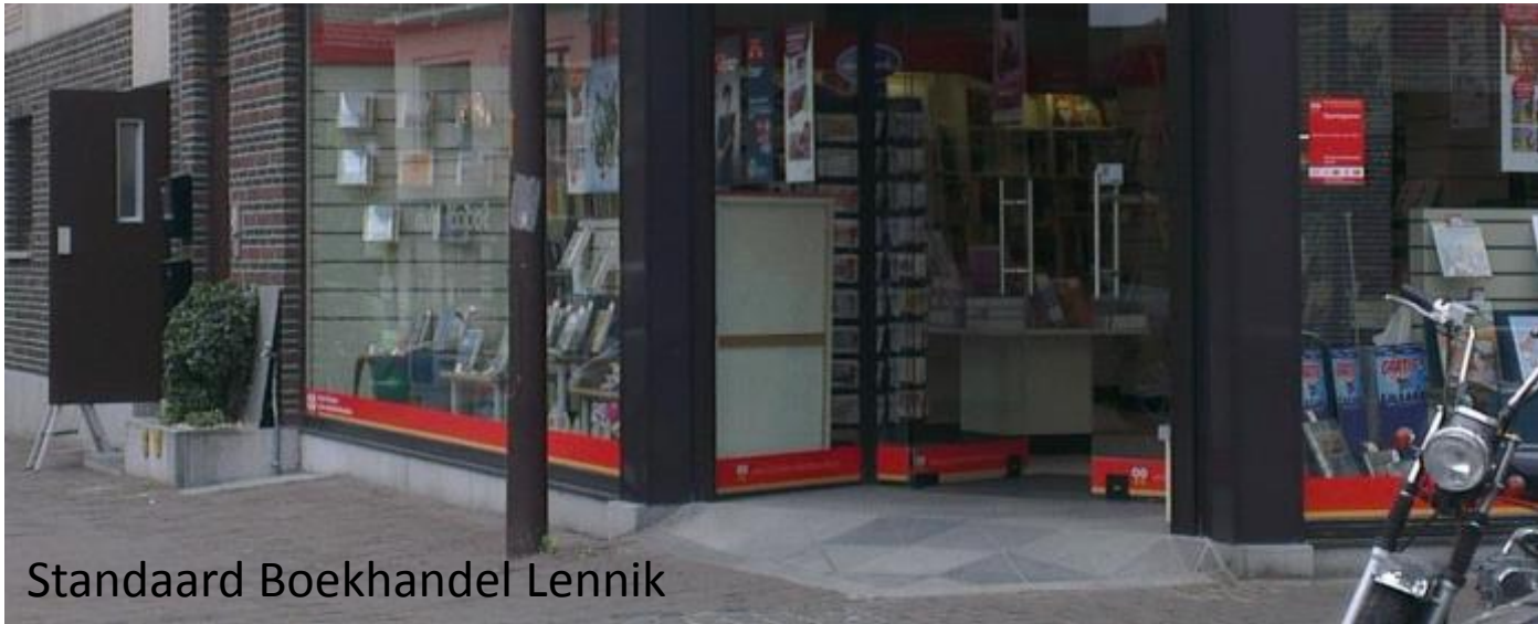
Standaard Boekhandel Lennik

Het Vlaams Agentschap Ondernemen heeft begin 2013 een oproep 'Handelskern versterkende maatregelen' gelanceerd.